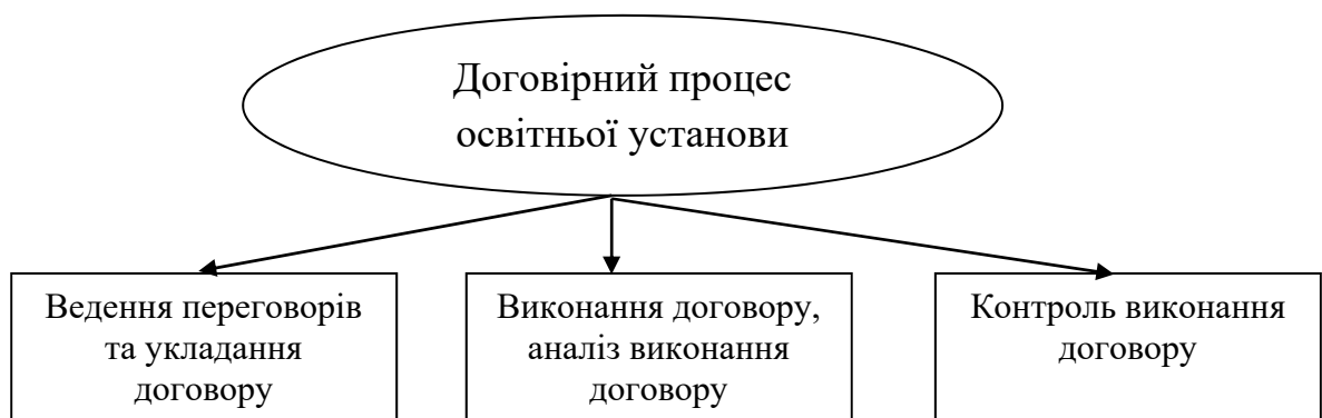
Рис. 1. Основні стадії договірному процесу освітньої установи

Виклад основних результатів та їх обґрунтування Договірний процес освітньої установи охоплює такі стадії (рис.1): ведення переговорів та укладання договору, виконання договору, аналіз виконання договору, контроль виконання договору.