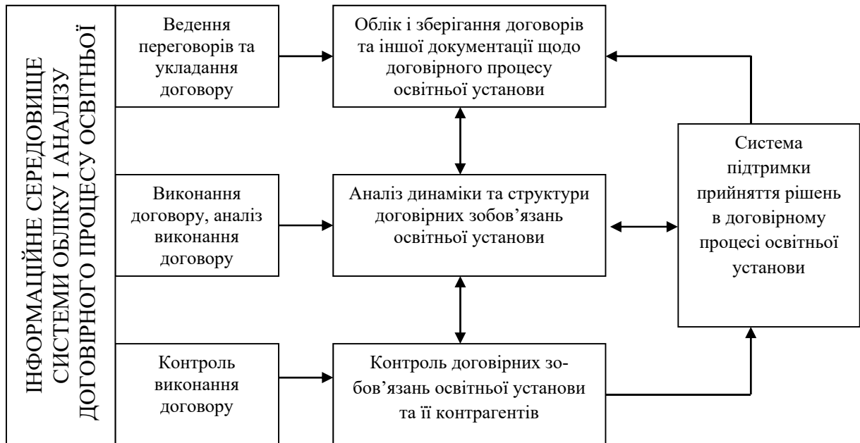
Рис. 3. Система обліку і аналізу договірному процесу освітньої установи при трансформації інформаційного середовища

Для удосконалення договірному процесу освітньої установи необхідно застосовувати нові методи управління і сучасні комп'ютерні технології. З їх допомогою освітні установи як у світі, так і в Україні зможуть використовувати найрізноманітніші інформаційні системи підтримки прийняття рішень в договірному процесі.