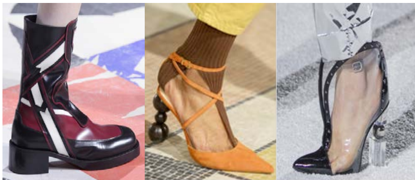
Рис. 2. Моделі взуття Christian Dior, Jacquemus, Balmain

На подіумах Тижня моди в Парижі, осінь-зима 2018/2019, були представлені всі види взуття (рис. 2). Дизайнери вирішили вражати не лише незвичайними формами, а й різноманітністю матеріалів: оксамит, атлас, шерсть, еко-шкіра, пластик і тканина [7].