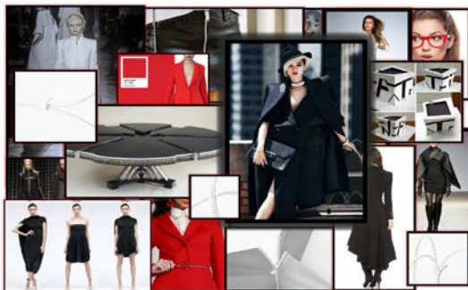
Рис. 1. Колаж колекції

Проаналізувавши напрями моди, принципи застосування методу трансформації розроблено колекцію жіночого одягу для роботи і ділових зустрічей. Концепція колекції полягає в тому, що одна багатофункціональна річ замінює 3-4 звичайних і дає більше можливостей у виборі одягу. Джерелом для дизайн-проекування колекції жіночого ділового одягу стали меблі-трансформери (рис. 1). Їх багатофункціональність, лінії і форми лягли в основу даної колекції. Функціональними елементами було обрано застібки, концепцію яких розробила японська компанія Nendo (рис. 2) [3].