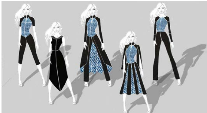
Рис. 3. Ескізи моделей колекції