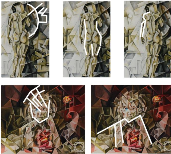
Рисунок 1 – Системно-структурний аналіз картин кубістів