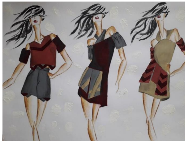
Рисунок 4 – Ескізи колекції

Висновки. Елементи, що були виділені в картинах художників кубістів цілком підходять для їх трансформації в сучасний молодіжний одяг. Вони можуть бути декоративними елементами у вигляді декоративно-конструктивного членування одягу або окремими конструктивними лініями в костюмі. Такий одяг може стати досить популярним серед сучасної молоді, бути зручним та практичним.