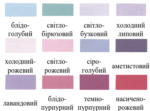
Рисунок 2 – Базові кольори для гардеробу кольоротипу Літо

При розробці індивідуальної комплексної багатокomпонентної системи «гардероб» для споживача необхідно враховувати колористичний зовнішності, тип статури і стильові уподобання, таблиця 1 [1, 3].