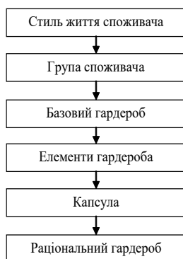
Рисунок 1 – Послідовність формування раціонального гардеробу споживачем

Результати дослідження. На основі досліджень [1-3] запропоновано методику проектування раціонального гардеробу з врахуванням потреб споживача: особливостей його зовнішності та темпераменту, а також сфери професійної діяльності. Вона представляє собою послідовність взаємопов'язаних етапів і має вигляд алгоритму, виконання якого дозволяє сформувати гардероб споживача з урахуванням базових кольорів певного кольоротипу, рис. 1, 2.