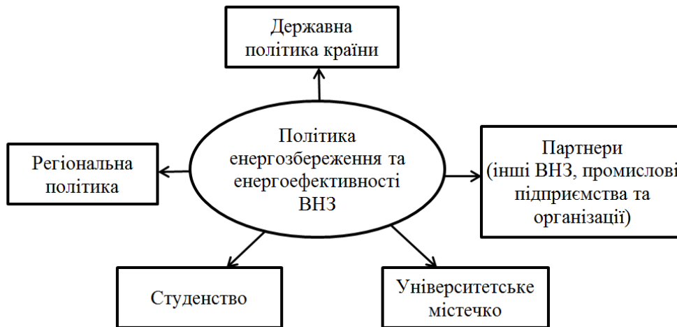
Рис. 1. Суб'єкти формування політики енергоефективності ВНЗ

Основні результати дослідження. Інтегрована система менеджменту – це сукупність кількох міжнародних стандартів у рамках однієї системи. За іншим визначенням, під інтегрованою системою менеджменту розуміється частина загальної системи менеджменту підприємства, організації чи установи (далі – організації), що відповідає вимогам двох чи більше стандартів на системи менеджменту, яка функціонує як єдине ціле і спрямована на задоволення зацікавлених сторін [4].