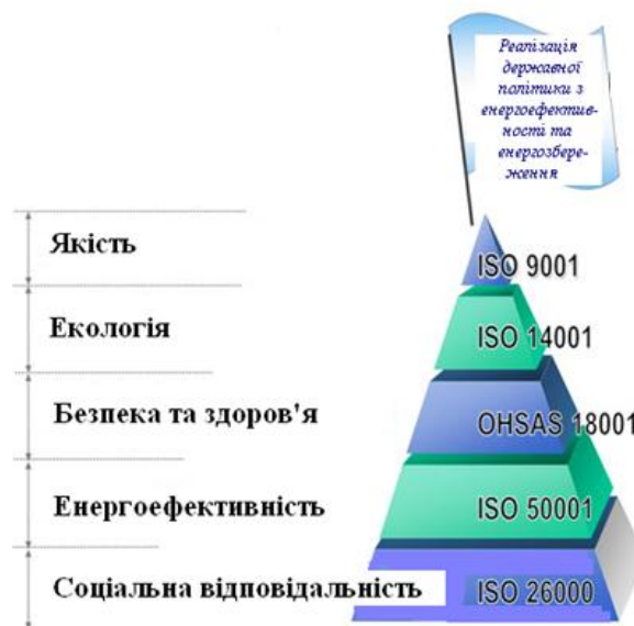
Рис. 2. Інструменти (системи менеджменту), які сприяють підтримці конкурентоспроможності ВНЗ

Основні результати дослідження. Інтегрована система менеджменту – це сукупність кількох міжнародних стандартів у рамках однієї системи. За іншим визначенням, під інтегрованою системою менеджменту розуміється частина загальної системи менеджменту підприємства, організації чи установи (далі – організації), що відповідає вимогам двох чи більше стандартів на системи менеджменту, яка функціонує як єдине ціле і спрямована на задоволення зацікавлених сторін [4].