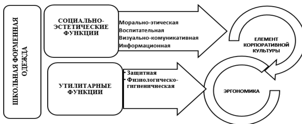
Рис. 1. Основные функции школьной форменной одежды

Следует отметить, что при проектировании форменной одежды для детей дизайнеры должны не только уделить повышенное внимание гармония в пропорциях и композиции костюма, но и обеспечить соответствия одежды особым потребностям тела ребенка разных возрастных групп, требованиям эргономичности и психологического комфорта ребенка (рис. 1). Это непосредственно влияет на задачи, которые должны быть поставлены и решены при проектировании школьной форменной одежды дизайнером [1].