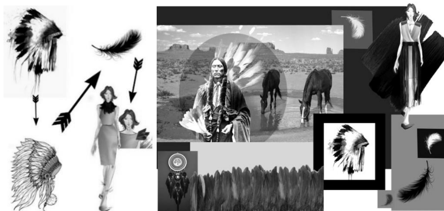
Рис. 2. Трансформація творчого джерела у художній образ

У стародавні часи Wambli Waraha – головний убір з орлиних був наділений багатим символізмом: найдрібніша його деталь мала глибокий сенс, а право носити такі головні убори мали тільки вожді і видатні воїни. На основі аналізу творчого джерела і його внутрішньої структури було розроблено геометрія форми, та лінії внутрішнього членування форми костюму, пристосовуючи їх до форми тіла людини, обираючи лінії в їх узагальненому вигляді та образному вирішенні (рис. 2). Поглиблюючись в історичні методи створення народного костюму індіанців, для розробки колекції моделей був використаний комбінований метод проектування, наколювання та класичне конструювання окремих елементів [2].