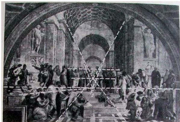
Рис. 3. Рафаель Санті (1483-1520) Фреска “Афінська школа”