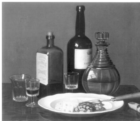
Рис.2 Волков Натюрморт Перша половина XIX ст..

І ще про одне відхилення від правил лінійної перспективи. Це застосування декількох точок зору і декількох горизонтів.