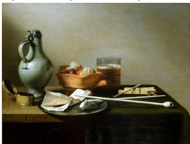
Рис.1 Пітер Клас (1597-1661) Люльки і жаровня