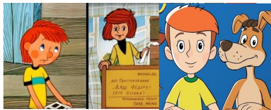
Рисунок 1 – Герої мультсеріалу «Троє з Простоквашино»

Мультсеріал «Троє з Простоквашино» - перше, що може прийти до вас в голову при словосполученні «герой мультика загадково змінився» серед анімації, що була на території сучасного СНД - це легендарні метаморфози персонажів цього мультфільму. Звичайно, проміжки між виходами великі, два роки між «Троє з Простоквашино» 1976 року і «Канікули в Простоквашино» 1980 року, і тільки через чотири роки настала «Зима в Простоквашино» [1]. Дядькові Федору кардинально не пощастило. Він виглядає кожен раз, як абсолютно різний хлопчик.