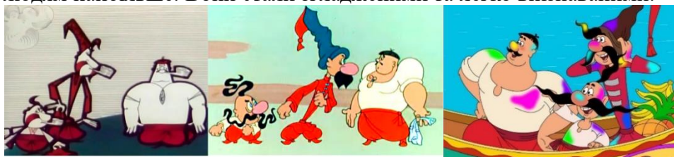
Рисунок 2 – Герої мультсеріалу «Козаки»

З 2016 року мультсеріал був подовжений епізодами «Козаки. Футбол» і ще з однією серією яка вийшла вже в 2018 році «Козаки. Навколо світу», де образи персонажів майже не змінилися, лише якість зображення через використання растрового малюнку стала трішки кращою. Колірна гама постраждала та надала деякої дешевизни мультсеріалу, тип самим спотворивши його.