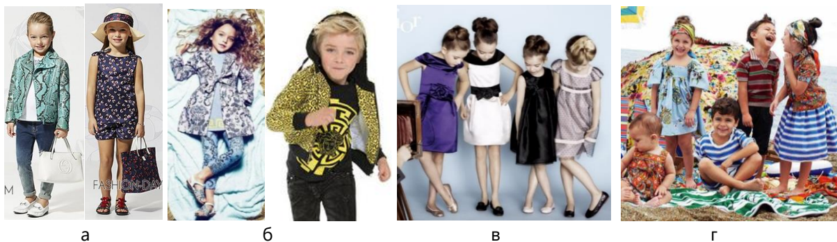
Рис. 3. Колекції дитячого одягу Будинків моди початку XXI ст.: а – Gucci, 2010 р.; б –Versace, 2012 р.; в – Dior, 2012-2013 р.; г – Dolce & Gabbana, 2013 р. [16]