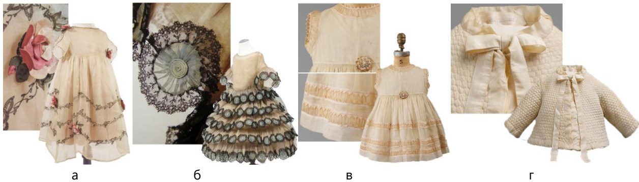
Рис. 1. Моделі дитячого одягу початку ХХ ст. Будинку моди Lanvin:

а – шифонова сукня з вишивкою та аплікацією у вигляді квітів троянд, 1923 р. [11]; б – сукня з оздобленням у вигляді троянд з блакитної органзи та чорного мережива, 1925 р., Музей Гальєра в Парижі [23]; в – бавовняна сукня з шовковими вставками, 1930 р., Метрополітен-музей, Нью-Йорк [22]; г – стьобана куртка з шовку, оздоблена бантом, 1931 р., Метрополітен-музей, Нью-Йорк [22]