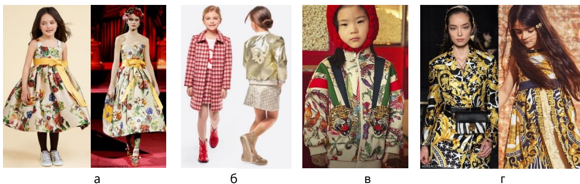
Рис. 4. Художньо-композиційні елементи дитячого костюма в колекціях Будинків моди сезону осінь-зима 2019/20: а – Dolce & Gabbana: квіткові мотиви [4]; б –Dior: аплікації з ініціалами бренда [8]; в – Gucci: анімалістичні принти [6]; г –Versace: античні орнаменти [12]