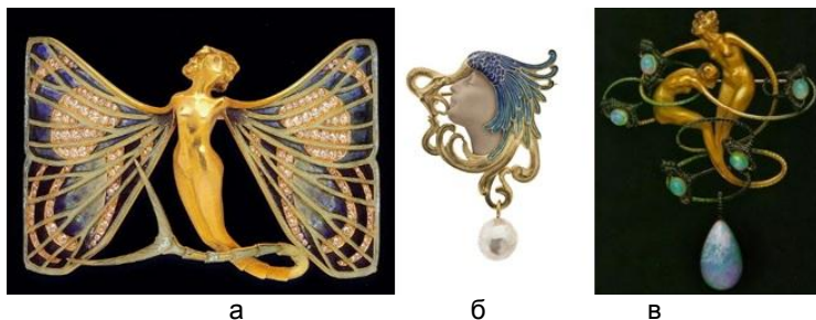
Рис. 4. Приклад жіночих образів у прикрасах Рене Лаліка: а – кольє-чокер (золото, діаманти, емаль), 1890-ті р.; б – брошка (золото, перлина, емаль, скло), 1898 р.; в – брошка (золото, емаль, австралійські опали), 1900 р.