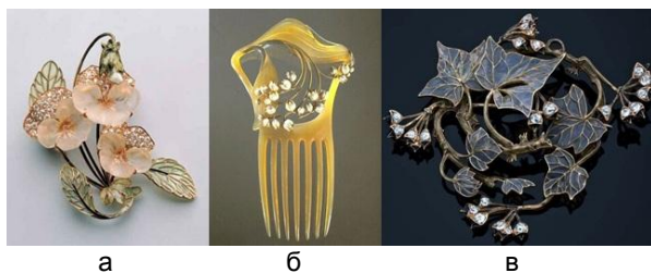
Рис. 1. Приклад рослинних мотивів у прикрасах Рене Лаліка: а – брошка (золото, діаманти, скло), 1900-ті р; б – гребінь (панцир черепахи, золото, емаль), 1897 р; в – брошка (золото, діаманти, скло), 1900-ті р.

У ювелірних виробах Рене Лаліка яскраво відобразилися всі візуальні особливості стилю Арт-Нуво – орнаменти, пастельні кольори, природні форми. Для рослинних мотивів у роботах Рене Лаліка характерні плавні лінії, кольорова гама виконана за допомогою емалей або скла (рис. 1). Флора в прикрасах може бути, як стилізованою, так і натуралістичною. В залежності від рослини, яку автор відтворює у ювелірних виробах, змінюється компонування оздоблювальних форм, застосовується метод симетрії або асиметрії. Зовнішній вигляд прикрас складає враження легкості, повітряності.