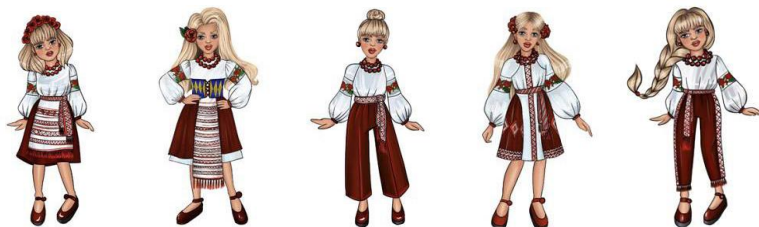
Рис.1. Колекція «Карпатська Верховина» дитячих трикотажних виробів

шляхом використання монорапортних орнаментальних композицій на базі української вишивки (рис.1).