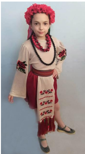
Рис.3. Фото базової моделі колекції

Для створення конкурентоспроможного асортименту трикотажних виробів вітчизняного виробництва в якості промислового зразка з покращеними споживчими властивостями виготовлено базову модель дитячої колекції (рис 3).