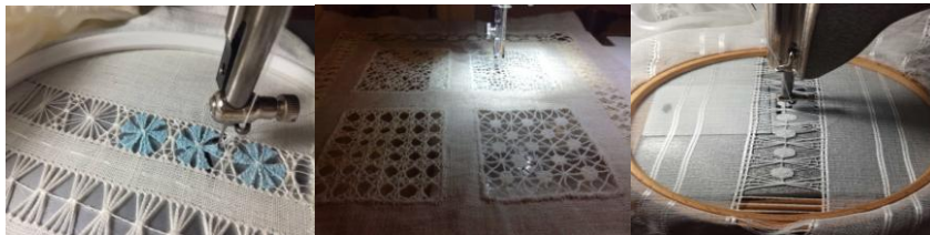
Рис. 2. Приклади схем вишивки мережка для дизайнерського одягу

Більш складні візерунки утворюються в комбінації різних технік та способів вишивки та швів в мережці. Так, використання турецького вузла в вишивці мережки створює ефект статичності, а хвилеподібний шов створює ефект легкості та динаміки [2].