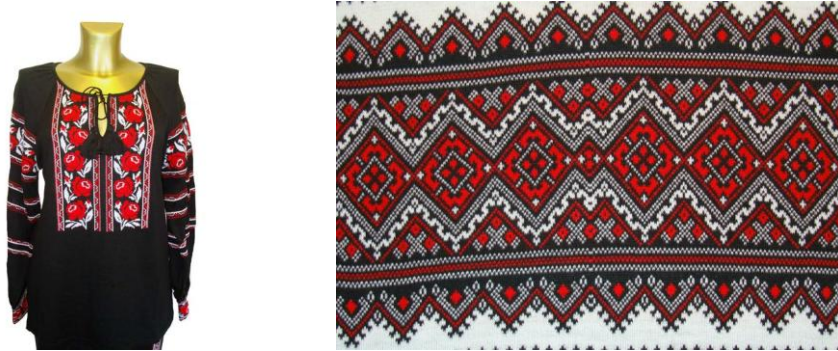
Рис. 1. Використання українського орнаменту в оздобленні трикотажу: жіночий асортимент (авторська розробка)

мотиви. Візерунки народного вишивання розроблялись у відповідності з формою предмета, тобто їх побудова залежала від призначення декорованої речі. Звідси впливали вибір матеріалу і техніка виконання [2]. Народний орнамент виник з життєвих вражень від спілкування з природою, в результаті осмислення цих вражень і втілення їх у зримі образи. В основу художньо-колеристичного рішення моделей асортименту у національному стилі покладено декоративно-естетичні функції орнаментальних мотивів Північної Буковини, Полісся та Поділля. Своєрідність цих орнаментів визначена у геометричності малюнків, які виникають внаслідок прагнення передати образи сонця, зірок, ріки, рослин тощо (рис.1, 2).