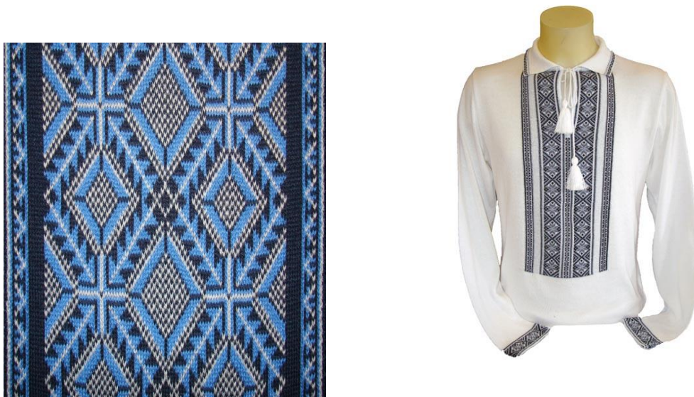
Рис. 2. Використання українського орнаменту в оздобленні трикотажу: чоловічий асортимент (авторська розробка)

Творчий хист художників-модельєрів компанії «Софія», їх прагнення до краси та вміння надати вжитковим речам глибокого мистецького змісту яскраво проявили себе в пошитті та декоруванні традиційного вбрання українських жінок – різноманітних джемперів-вишиванок, тунік, спідниць, суконь, тощо.