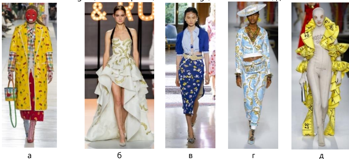
Рис. 3. Принти в одязі в стилі поп-арт (предметне зображення) [6, 7]: а – Thom Browne, б – Ralph Russo, в – Altuzarra, г – Moschino, д – Moschino

Провівши аналіз колекцій одягу весна-літо 2019 та 2020 рр., було виявлено, що в принтах колекцій жіночого одягу в стилі поп-арт популярними є зображення