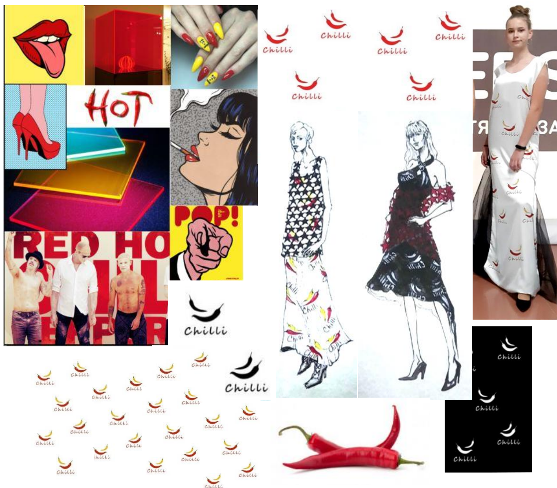
Рис. 6. Колаж розробленої авторської колекції жіночого одягу та принтів в стилі поп-арт