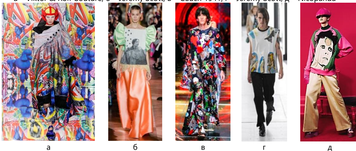
Рис. 2. Принти в одязі в стилі поп-арт (малюнки муралів та колажі) [6, 7]: а – Maison Margiela, б – Schiaparelli, в – Balenciaga, г – Louis Vuitton, д – Undercover