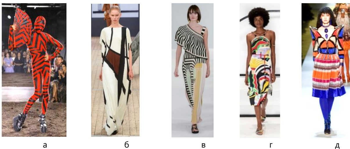
Рис. 4. Принти в одязі в стилі поп-арт (геометричні мотиви та кольорові поєднання) [6, 7]: а – Gareth Pugh, б – Akris, в – Temperley, г – Emilio Pucci, д – Jean Paul Gaultier

У сезоні весна – літо 2020 р. журналом Vogue представлено 133 колекції жіночого одягу, 8 дизайнерів використовували принт стилю поп-арт в якості декорування одягу, що складає 6% загального обсягу жіночих колекцій. Чоловічий одяг сезону весна – літо 2020 р. представлений 67 колекціями, 16 дизайнерів застосували принти в стилістиці поп-арт, що складає майже 24% загального обсягу чоловічих колекцій. В наслідок порівняння застосування декоративних принтів в стилі поп-арт в жіночих та чоловічих колекціях одягу можна зазначити що в чоловічих колекціях в сезоні весна – літо 2020 р. вони набувають популярності.