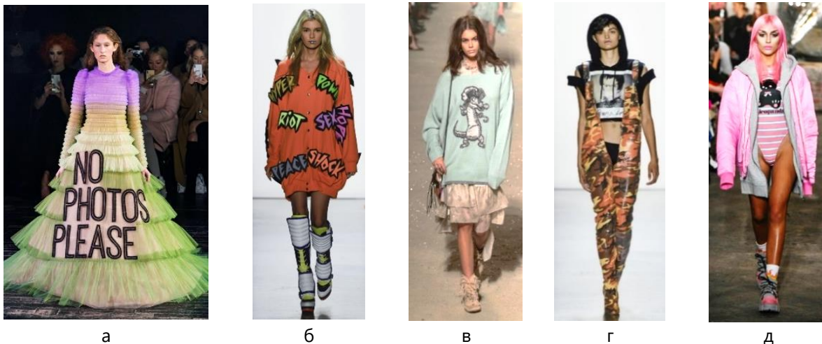
Рис. 1. Принти в одязі в стилі поп-арт (леттерінг, комікси та аніме) [6, 7]: а – Viktor & Rolf Couture; б – Jeremy Scott; в – Coach 1941, г – Jeremy Scott, д – Nicopanda