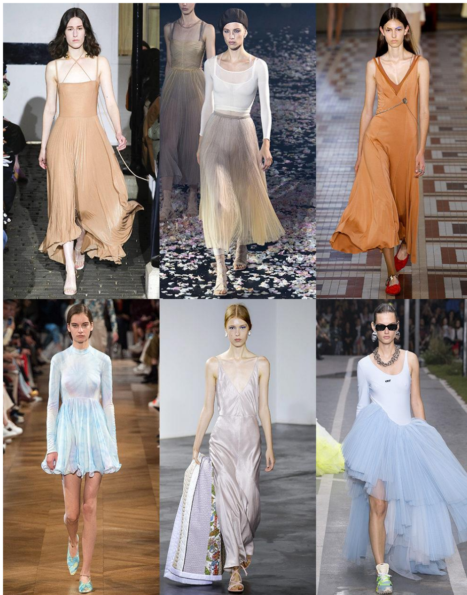
Рис. 1. Діор, Валентіно, МакКуїн, весна-літо 2019-2020 рік

2019-2020, можемо виділити наступні: в жіночих сукнях домінують жіночні а силуети підкреслюючи лінію талії за допомогою крою та декоративних пасків; кольорова гама відрізняється ніжністю і легкістю відтінків.