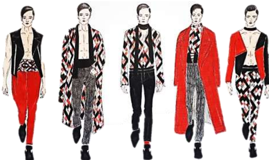
Рис. 1 – Авторська колекція чоловічого трикотажного одягу

В колекції запропоновано бежеві, коричневі, темно-рожеві, червоні, чорні, білі та сірі кольори. Базовий візерунок колекції (рис.2) – шкіра пітона виконано у вище сказаній кольоровій гамі. Орнамент побудовано на контрастних кольорах з ритмічним