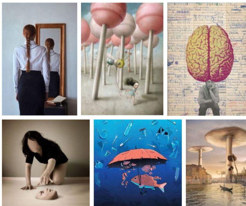
Рис. 2. Приклади використання у сучасній концептуальній ілюстрації прийомів фото колажу, плакату та мультиплікації – можуть розглядатись як самостійна форма станкової графіки

Постмодернізм як концептуалізм в образотворчому мистецтві явив собою сукупність тенденцій у художній культурі II пол. XX ст., зв'язаних із радикальною переоцінкою цінностей авангарду. Нові прояви авангарду виражаються у більш самокритичному відношенні мистецтва до себе, війна з традицією змінюється співіснуванням з нею, характерною рисою стає стилістична різноманітність. Концептуалізм, відмовляючись від раціоналізму «інтернаціонального стилю», звернувся до наочних цитат з історії мистецтва, міксуючи або синтезуючи їх, запропонував власне, нерідко суб'єктивне, бачення навколишнього світу, сполучаючи усе це з новітніми досягненнями комп'ютерних технологій й проголосивши гасло «відкритого мистецтва», вільно взаємодіючого з усіма іншими видами, старими і новими стилями. Тому не дивно, що прийоми плакату, наочної реклами, мультиплікації тощо стали засобами самовираження представників концептуальної ілюстрації (рис. 2).