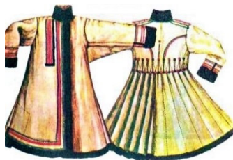
Рис.1. Кожух, Черкащина

Результати досліджень. Одяг, виготовлений нагольним способом (хутром усередину) був характерний для східних слов'ян, що жили на території сучасної України [4]. Він трансформувався від овечої шкури, якою обгортали тіло, до складних і різноманітних форм, характерних для народного костюму різних областей України (рис.1).