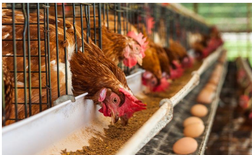
Рис. 1. Птахоферма

Як приклад, можна привести курей. Кури повинні їсти якісну їжу і разом з нею отримувати вітаміни, кальцій, фосфор та інші корисні елементи. Якщо чітко дотримуватися режиму годування, птахи будуть нестися увесь рік. А ось при «випадковому» раціоні, коли кури їдять усе підряд, важко домогтися високої продуктивності (рис. 1).