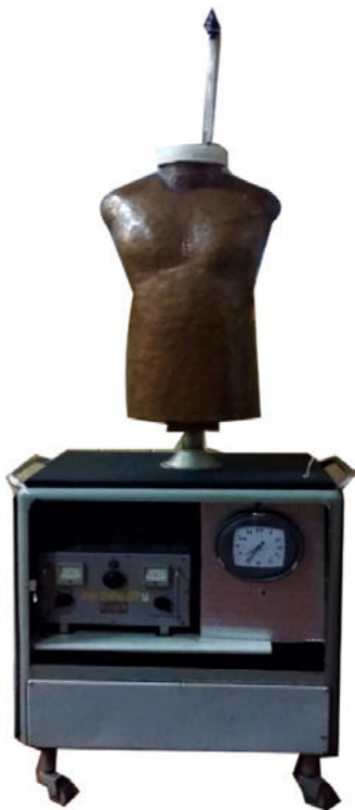
Рисунок 1 – Зовнішній вигляд (фото) імітаційного теплового стенду торсу людини (ІТСТЛ).

Теплопродукція в мідному торсі 1 моделюється основним джерелом тепла - спіральним нагрівачем 3. Для регулювання потужності нагрівача 3 та температури нагріву поверхні манекену застосовується блок живлення 8. Контроль потужності нагрівача здійснюється за допомогою амперметра 5 і вольтметра 6. Для рівномірного розподілу тепла по поверхні манекену використовується блоки розподілу нагрітого повітря 2. Температура поверхні манекену контролюється термоміром, який складається з шести термомірних датчиків 4 та потенціометру 7 постійного струму ПП - 63.