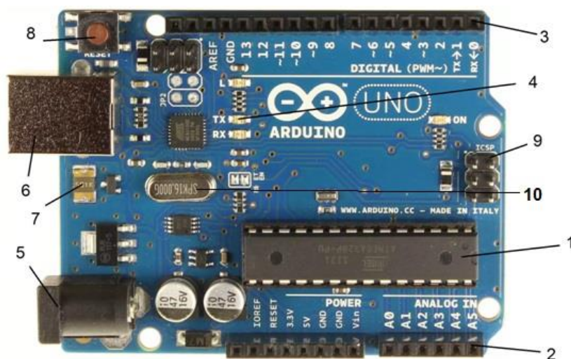
Рис. 1. Контролер Arduino Uno

Arduino Uno (рис. 1) – контролер побудований на ATmega328 (1). Платформа має 14 цифрових вход / виходів (6 з яких можуть використовуватися як виходи ШІМ) (3), 6 аналогових входів (2), кварцовий генератор 16 МГц (10), роз'єм USB (6), силовий роз'єм (5), інтерфейс ICSP (9) і кнопку перезавантаження (8). Для роботи необхідно підключити платформу до комп'ютера за допомогою кабелю USB, або подати живлення за допомогою адаптера AC / DC або батареї. На відміну від всіх попередніх плат, які використовували FTDI USB мікроконтролер для зв'язку з USB, новий Ардуіно Uno використовує мікроконтролер ATmega8U2. "Uno" перекладається як один з італійського і розробники тим самим натякають на майбутній вихід Arduino 1.0. Нова плата стала флагманом лінійки плат Ардуіно [4].