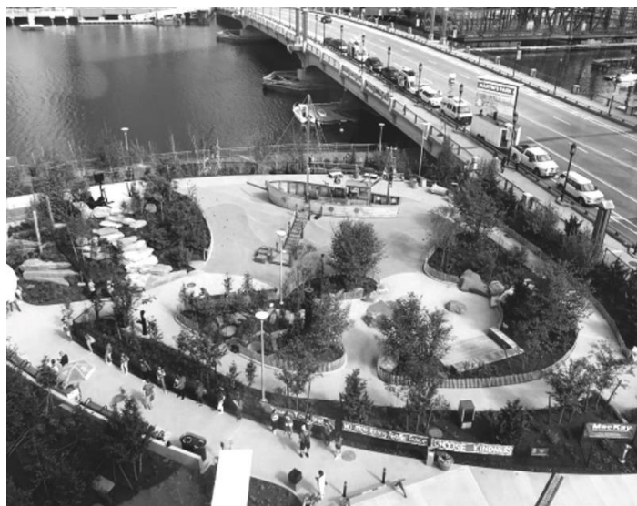
Рис. 4. Дитячий майданчик у Мартінс Парк, Массачусетс

собою значну мотивацію для людей із обмеженими можливостями і дають можливість комунікації з людьми, що мають спільні інтереси [16].