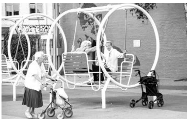
Рис. 5. Гойдалки для літніх людей та людей з інвалідністю у парку Суперкілен, Данія

При формуванні простору парків пропонують виділяти зони: прогулянкова зона, основу якої складає маркований прогулянковий маршрут, велосипедні доріжки та дороги для кінних прогулянок; зона культурно-просвітницьких заходів із розміщенням кафе, лекторіїв, ресторанів та атракціонів; зона дитячого відпочинку із пісочницями, майданчиками технічного моделювання, майданчики для активних ігор та ін.; зона масових заходів із облаштуванням майданчиків для ігор, танців; зона фізкультурно-оздоровчих заходів; господарська зона та зона обслуговування із адміністративними будівлями, точками громадського харчування та господарськими майданчиками [8].