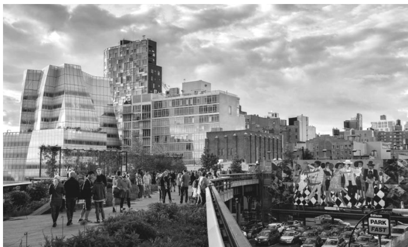
Рис. 1. Хай-Лайн парк у районі Челсі, Манхеттен

Хай-Лайн Парк – це парк, що створений на занедбаній залізничній естакаді у Манхеттені (рис. 1). Під залізничною гілкою естакади проходять автомобільні смуги, розміщені промислові склади, автомобільні стоянки, що будуть перебудовані на магазини та ресторани, а над естакадою – бутик-готель. Після остаточної перебудови парку його довжина становитиме 2,33 км [17].