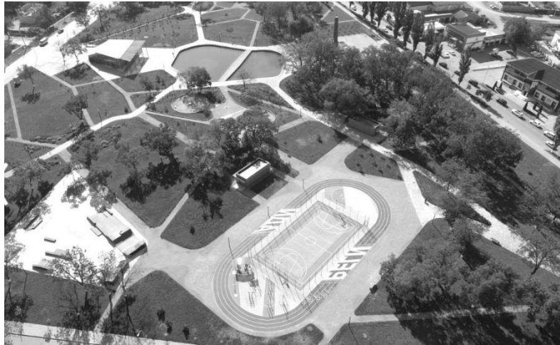
Рис. 6. Парк Хусейн Бін Талал у Грозному, Росія

Цікаві рішення організації спортивних зон із екстремальним улихом прийняті при створенні парку Хуйсейн Бін Талал, Росія (рис. 6). Територія парку містить розгалуджені зони скейт-парку, ігрові та спортивні майданчики, амфітеатр та інші зони пасивного відпочинку, тому кожен відвідувач може знайти собі заняття по душі. Парк орієнтований на широке коло відвідувачів – від дітей до людей похилого віку [12].