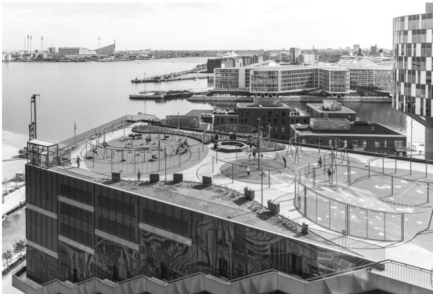
Рис. 3. Парк «Park 'n' Play», Данія

Також прикладом вдало сформованого рекреаційного простору на даху є парк «Park 'n' Play» в Данії (рис. 3). Це спортивний майданчик, що створений для перетворення монофункціональної будівлі паркінгу у багатофункціональну. Парк орієнтований на широке коло користувачів різного віку. Окрім благоустрою даху будівлі, будівля відзначається цікавим рішенням в озелененні фасадів [15].