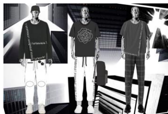
Рис. 3. Фор-ескізи чоловічого молодіжного одягу, виконані за допомогою мобільного додатку PicsArt