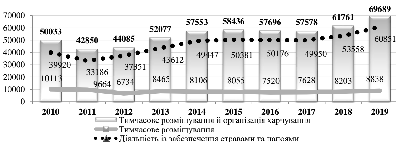
Рис. 1. Динаміка кількості підприємств готельно-ресторанного бізнесу (побудовано автором за даними [1])

Світова бізнес-практика позиціонує готельно-ресторанний бізнес, як один з найприбутковіших і швидко розвиваючихся. Так, за даними Державної служби статистики України [1], у 2019 р. функціонувало 69689 підприємств готельно-ресторанного бізнесу (рис. 1). Із 69689 підприємств, які здійснювали господарську діяльність, 69382 (99,56 %) – суб'єкти малого підприємництва, 304 (0,44 %) – середнього і 3 – великого [1]. Динаміка кількості підприємств готельно-ресторанного бізнесу за аналізуємий період є неоднозначною, але за останні три роки має тенденцію до зростання.