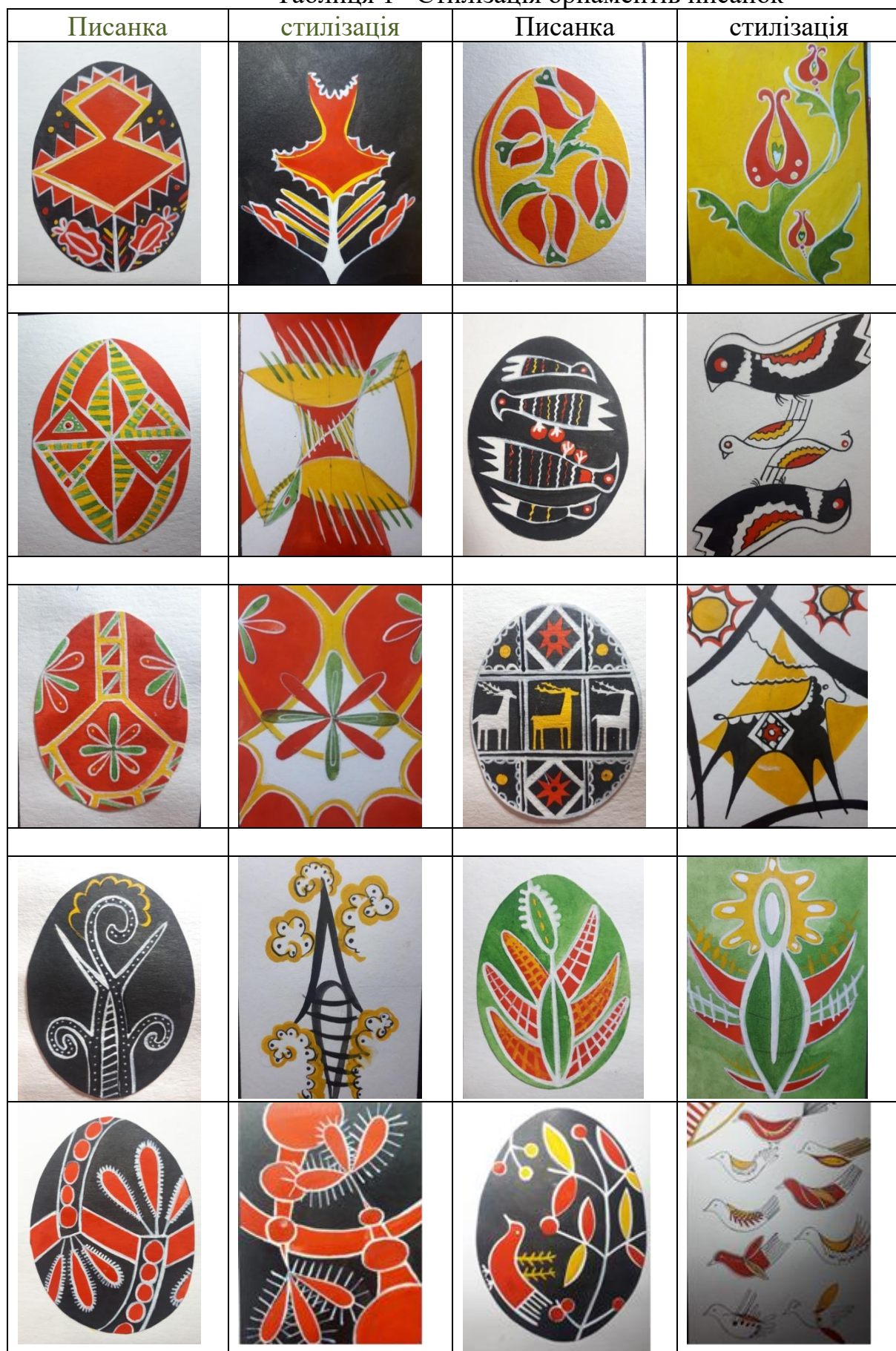
Таблиця 1– Стилізація орнаментів писанок