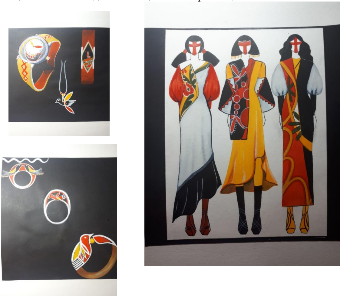
Рис. 1. Ескізний проект «Писанка», асортимент аксесуарів

Таку писанку кладуть в колиску до народження немовляти. Зозуленька на писанці пишеться без ділення яйця на сектори – одна пташка і гілочки.