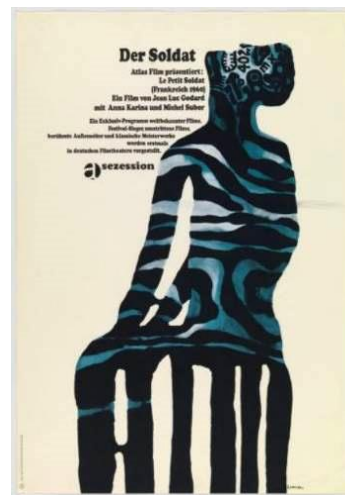
Рис. 4. Ян Леніца «Солдат», 1966 р. [14]