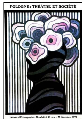
Рис. 6. Ян Леніца «Польща: театр та суспільство», 1972 р. [13]