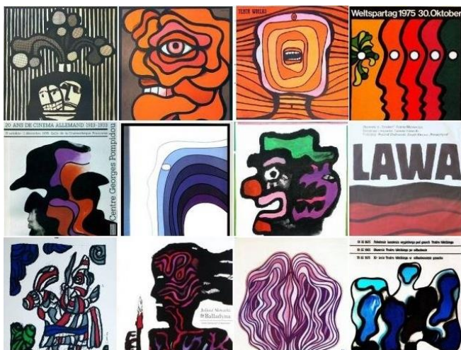
Рис. 3. Хвиляста лінія у плакатах Я. Леніца [13]