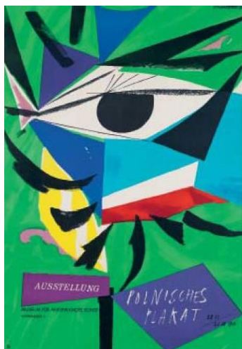
Рис. 1. Афіша виставки польських плакатів, 1956 р. [11]