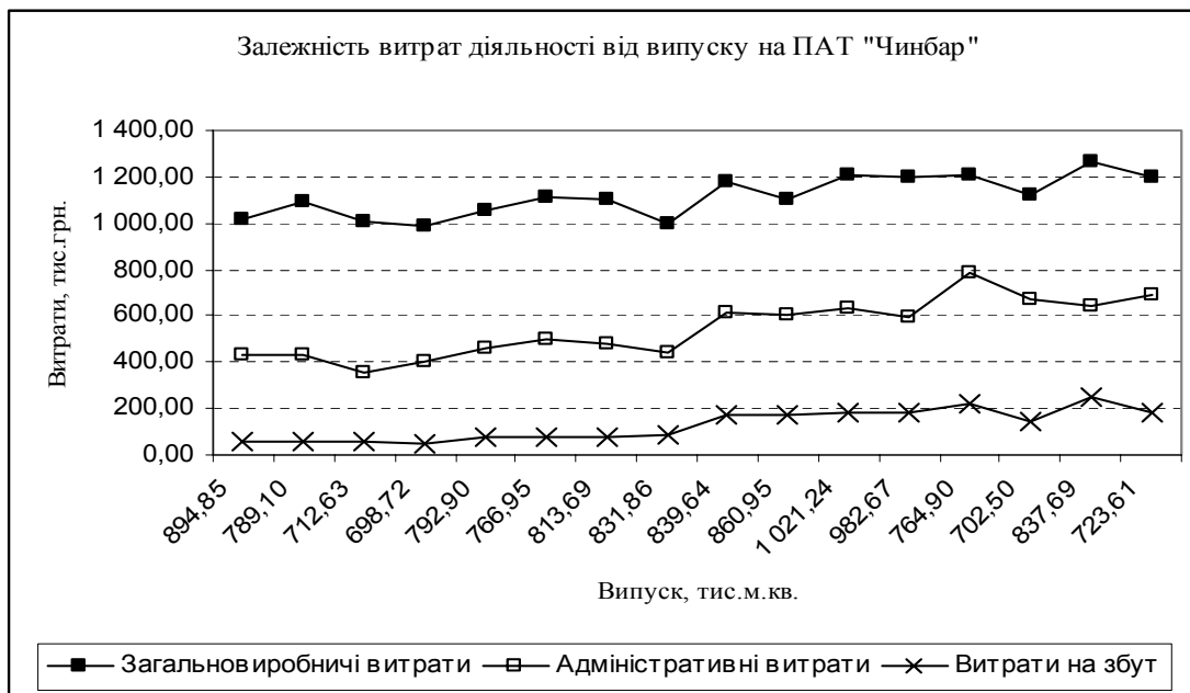
Рисунок 3 – Аналіз динаміки витрат діяльності залежно від обсягу випуску продукції за 2009-2012 рр.

Таким чином, можна зробити висновок, що у структурі тих витрат, що більше залежать від зміни випуску, переважає змінна їх складова, а у тих, які залежать опосередковано – постійна їх складова.