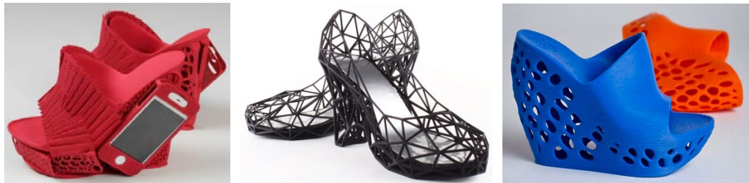
Рис. 10. Полімерне взуття, створене за технологією 3D-друку