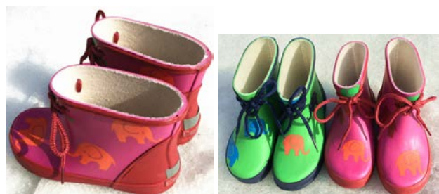
Рис. 2. Гумові чобітки на текстильній підкладці

Взуття другої групи – це, найчастіше, гумові чоботи, чобітки або напівчеревики, всередині яких є підкладка з текстильного матеріалу або штучного хутра (рис. 2, рис. 3). Технологія виробництва такого взуття часто є оригінальною, характерною тільки для взуттєвого виробництва, але широко застосовуються і процеси, типові для галузі переробки еластомерів та пластмас. У якості підкладки чобота використовують панчошу, виготовлену з трикотажного полотна. Зшита підкладка подається до литтєвого автомату, після запуску якого технологічний процес протікає автоматично у визначеному робочому циклі [2].