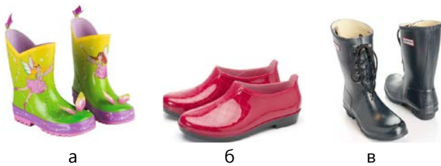
Рис. 3. Полімерно-текстильне взуття: а – дитяче; б – жіноче; в – чоловіче

Третя група – суцільнополімерне взуття, у якому і верх, і підошва виготовляються виключно з полімерних матеріалів. При цьому в одному виробі можуть комбінуватися різні полімерні матеріали або різні кольори одного й того самого матеріалу. Останніми роками асортимент суцільнополімерного взуття значно розширився. Якщо донедавна виготовлення такого виду взуття обмежувалося гумовими чоботами, калошами та шльопанцями, то сьогодні взуттєва промисловість пропонує широкий вибір яскравого дитячого та молодіжного, зручного побутового та спеціального