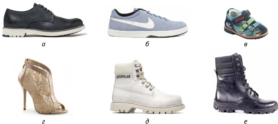
Рис. 1. Комбіноване взуття з верхом зі шкіри чи текстилю та полімерною підошвою: а – чоловіче; б – спортивне; в – дитяче; г – жіноче; д – для активного відпочинку; е – спеціальне (берці армійські)

прес-форми або вирубуванням деталей підошви з листового полімеру з наступним приклеюванням їх до заготовки верху взуття. Також поширеним є литтєвий метод кріплення полімерної підошви, при якому підошва приливається одразу на заготовку верху.