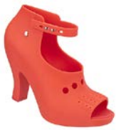
модель Melissa Glove Love

Револьюційний підхід до виробництва продукції не залишився непоміченим з боку всесвітньо відомих дизайнерів – з брендом працюють найбільш відомі представники fashion-індустрії. Зокрема, німецький модельєр Карл Лагерфельд створив для компанії кілька колекцій взуття (моделі однієї з них наведено на рис. 6).