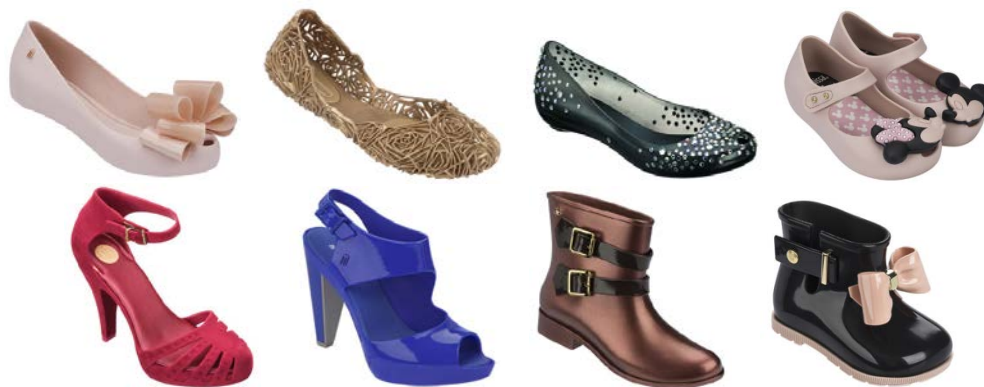
Рис. 5. Взуття MELISSA, виготовлене повністю з полімерного матеріалу

пластичний та витончений. На його основі виготовляється все взуття Melissa, від туфель до ботильонів. Вироби Melissa мають характерну особливість – взуття має приємний цукерковий аромат. Взуття Melissa є зразком передових технологій – створене з унікального м'якого пластику, воно довгий час не втрачає своїх достоїнств: презентабельного зовнішнього вигляду, неймовірної міцності, довговічності.