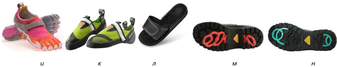
Рис. 11. Взуття зі вставками або з підшвою складної форми:

а – футбольні бутси з шипами; б – шиповки для бігу; в - з – кросівки з підшвою складної форми; и – печатки для ніг для паркуру, дайвінгу, греблі, йоги, скалолазання тощо; к – взуття для альпінізму; л – масажне взуття; м - н – взуття для використання на слизькому ґрунті.