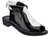
модель Melissa Black Tie