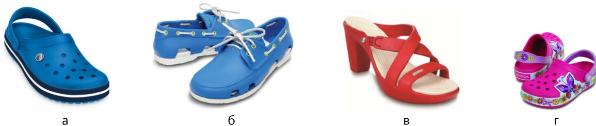
Рис. 4. Взуття CROCS: а – універсальне; б – чоловіче; в – жіноче; г - дитяче

Одним із лідерів у виробництві суцільнополімерного взуття на світовому ринку є компанія CROCS (США) [3]. Компанія розробила та запатентувала матеріал Croslite™, який надає унікальних властивостей взуттю, що випускається, рецептура матеріалу тримається у секреті. Взуття зручне, м'яке та пружне, нога у ньому не пітніє та не ковзається. Продукція компанії досить дорога, проте попит на неї збільшується з кожним роком, ринки збуту розширюються – з моменту створення компанії у 2002 році географія бренду поширилася на 125 країн світу. Також росте асортимент продукції – якщо першими виробами були клоги доволі грубого вигляду, то сьогодні компанія може запропонувати не менш комфортне, але яскраве та стильне взуття різних колекцій, що налічує більше 300 моделей на різний смак (рис. 4).