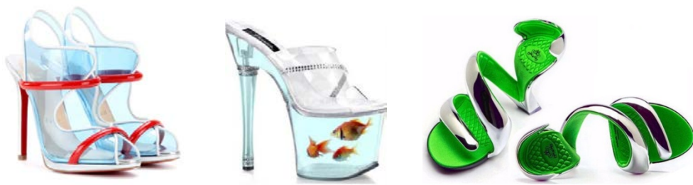
Рис. 9. Оригінальне дизайнерське взуття із полімерних матеріалів