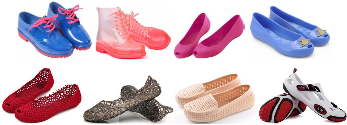
Рис. 8. Суцільнополімерне взуття китайських виробників