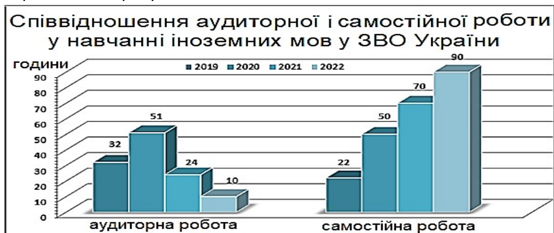
Рис. 1. Співвідношення аудиторної і самостійної роботи в закладах вищої освіти України в навчанні іноземних мов з 2019 по 2022 рік

На рис. 1 наведено дані системного аналізу самостійної роботи у співвідношенні з аудиторною роботою в закладах вищої освіти України з 2019 року.