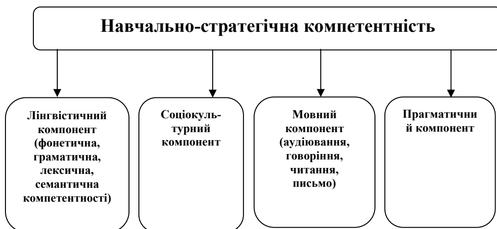
Рис. 3. Структурні компоненти навчально-стратегічної компетентності

На рис. 3 ми наводимо структурні компоненти навчально-стратегічної компетентності.