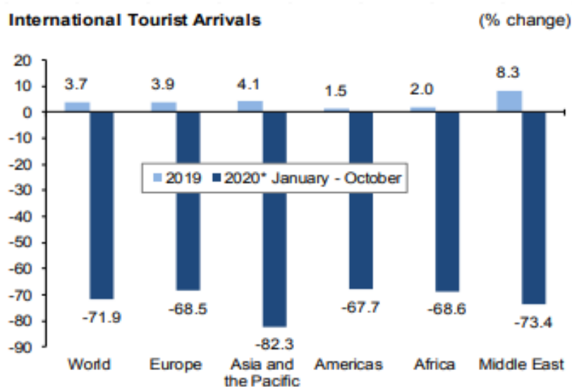
Рис. 1. Динаміка міжнародних туристичних потоків у 2019-2020 роках

прибуттів. Так у 2019 році кількість міжнародних прибуттів досягла близько 1,5 мільярда, що на 4%, або на 4 мільйони перевищує показники 2018 року [1]. Проте, через пандемію коронавірусу за десять місяців 2020 року кількість міжнародних перевезень скоротилась порівняно з попереднім роком на 71,9 %. Найбільше скорочення в'їзних туристичних потоків відбулося в країнах Азії (82,3 %) та Близькому Сході (73,4 %), в Африці в'їзні туристичні потоки скоротилися на 68,6 %, в Європі на 68,5 %, в Америці на 67,7 % (рис. 1). Скорочення міжнародних перевезень призвело до скорочення доходів від міжнародного туризму на 935 млрд. доларів, вони повернулися до рівня 1990 року.