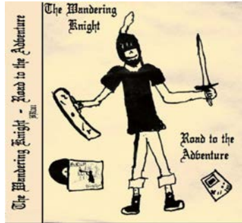
Рис. 1. Типове дизайн-оформлення обкладинки CD-диску музичного альбому жанру Dangion Synth «Road to the Adventure» (2020)

Synth. Його успішне розповсюдження серед широкого загалу полягає в тому, що дизайн продукції зазвичай має дуже просте, наївне і, навіть з присмаком «халтури», оформлення (Рис 1). Таке оформлення може справити негативне візуальне враження в порівнянні з більш яскравими та привабливими дисками інших музичних жанрів (Рис.2).