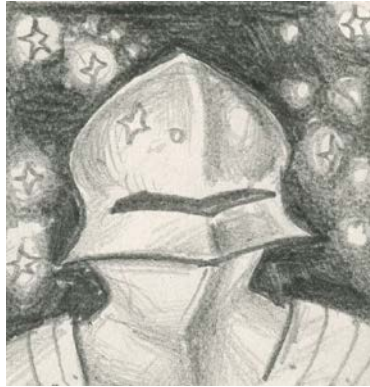
Рис. 3. Ескіз, який отримав найбільше схвальних відгуків, отриманих за допомогою методу «Гірлянд асоціацій» Г.Буша [2]

Проаналізовано сучасні тенденції оформлення дизайну музичної продукції (обкладинок для музичних дисків), виявлено стилі та техніки, які використовують сучасні дизайнери в процесі розробки дизайну. В результаті було розроблено дизайн продукцію для студії звукозапису «AcidDized» на основі фотозображень. Фокус група працювала з ескізами обкладинки, які були виставлені на платформі Google Forms, за методом пошуку асоціацій. Кожний учасник зміг висловити власну думку и обрати той ескіз, який найбільше відповідав музичному твору. Ідея, що набрала більше схвальних відгуків була взята за основу для розробки дизайну обкладинки (Рис.3).