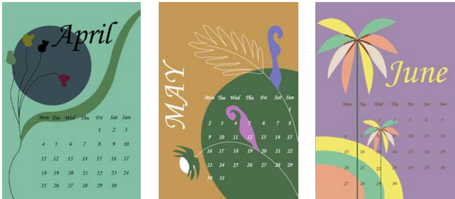
Рис. 2. Сторінки календаря – квітень, травень, червень