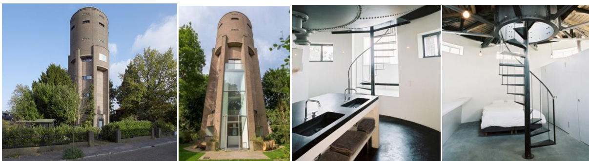
Рис. 2. Водонапірна вежа в Сусті, Нідерланди

Свого часу в кожному цивілізованому місті було по кілька водонапірних веж. А в посушливих країнах водонапірна вежа була епіцентром суспільного життя поселення, його віссю. У місті Афула (Ізраїль) стара водонапірна вежа і тепер сприймається, як домінанта міста. Хоча в наші дні такі об'єкти використовуються все рідше, старіють і руйнуються. Однак зі зростанням чисельності населення міст і попиту на житло, такі об'єкти все частіше пристосовують під приватні апартаменти. Співвідносячи функцію житла з композиційної типологією промислових споруд варто відзначити, що найбільш вдало і раціонально вона реалізується в адміністративних і виробничих приміщеннях міських мануфактур, старовинних портових складах. Але існують і більш рідкісні приклади – розміщення житла в циліндрах газосховищ і цукросховищ, а також перебудова водонапірної башти в готель, офіс, музей та ін. [6, с. 91].