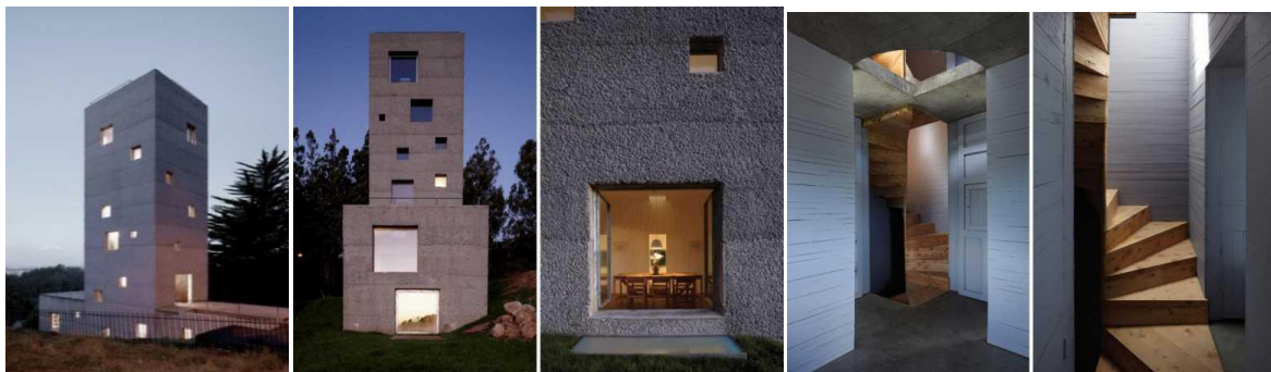
Рис. 4. Творча студія, місцевість Консерсіон (Чилі); арх. Mauricio Pezo і Sofia von Ellrichshausen

Культурно-дозвіллева функція передбачає організацію в об'єктах конверсії культурних центрів, бібліотек, творчих студій, клубів. Культурні центри часто діють як виставкові, концертні та театральні майданчики. Тут же можуть знаходитися репетиційна база і балетні класи, художні та музичні гуртки, лекторії, бібліотека. Залежно від наповнення, у них існує той чи інший профіль: культурно-розважальний або освітній. Така функція передбачає використання різних композиційних елементів. Якщо дозволяють простори, тут можуть розміщуватися репетиційні приміщення і естрадні майданчики. Можуть бути задіяні не тільки освітлені приміщення, але і темні відсіки інтер'єрів [6, с. 93].