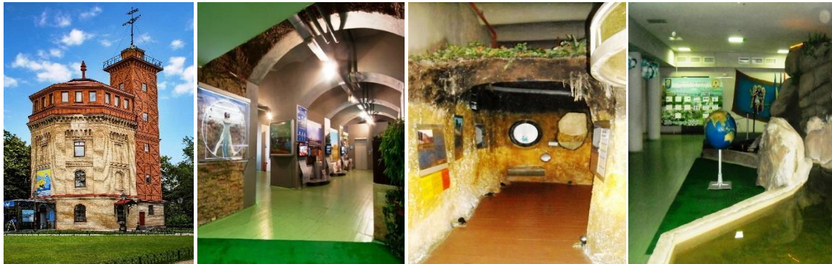
Рис. 5. Музей води в Києві (Водно-інформаційний центр)

першому поверсі. Сама п'ятиповерхова вежа піднімається від його центру, створюючи суміш побутових приміщень і робочих студій, з'єднаних гвинтовими сходами. Проста прямолінійна сітка визначає розташування приміщень всередині будівлі. Конструкція є монолітним нашаруванням бетону. В інтер'єрі стіни оббиті панелями з пофарбованого дерева, в які вмонтовані оцинковані сталеві рами вікон [9].