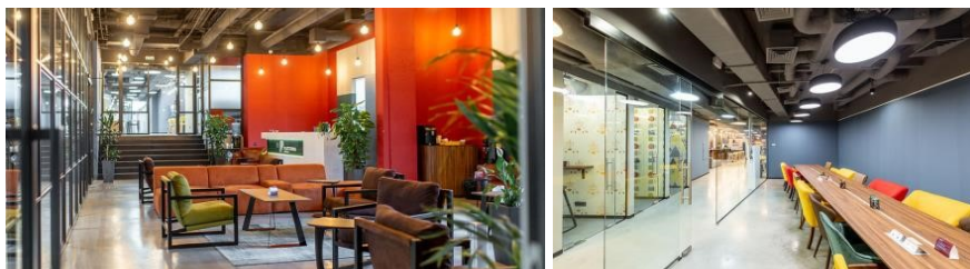
Рис. 2. Platforma Futura. Львів.

У Дніпрі унікальну локацію складає Creative State of Dnipro (Рис. 3), де резидентам доступні офіси для команд будь-якої кількості учасників, зона нефіксованих робочих місць, величезний лаунж з баром, оснащені переговорні кімнати, зал для заходів, кухня [5].