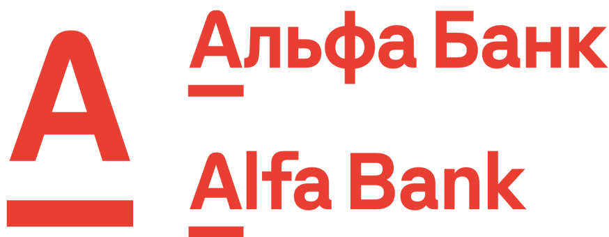
Рис. 2. Оновлений логотип «Альфа-банк Україна»

Компанія також представила додаткові варіанти логотипу, які будуть використовуватися в окремих випадках. У таких варіантах логотип з літерою “А” більше не буде стояти поруч із назвою, а з’явиться всередині слова (рис. 2). Фірмовим шрифтом «Альфа-банку» став гротеск Бертона Хасіба (Berton Hasebe) Styrene [5].