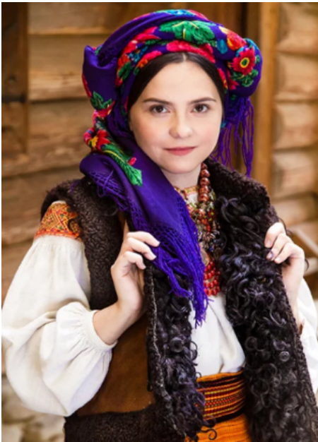
Рис. 1. Гуцульський одяг з колекції родини Гривулів

Вже не перший сезон провідні українські дизайнери та світові будинки мод черпають натхнення для своїх колекцій саме з етніки. Головна ідея таких поєднань – це підтримка історичних та культурних цінностей народу. Іншим напрямом в етнодизайні є модернізація вже традиційних речей, в поєднанні з новими елементами і предметами, тим самим створюючи цікаві та креативні образи для сучасного користувача. Використання українського орнаменту в сучасних трикотажних виробках досліджене в статті (Melnyk et al., 2021). Технологія виконання сучасної машинної вишивки з використанням традиційних українських рослинних мотивів обґрунтована в дослідженні (Yezhova et al., 2018).