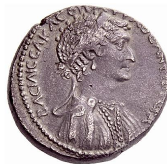
Рис. 2. Монета із зображенням профілю Клеопатри. 37–33 г. до н.е. Altes Museum, м. Берлін, Німеччина