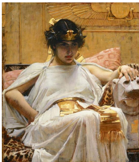
Рис. 3. Д. Уотерхаус. Клеопатра. Полотно, олія. 1888. Приватне зібрання