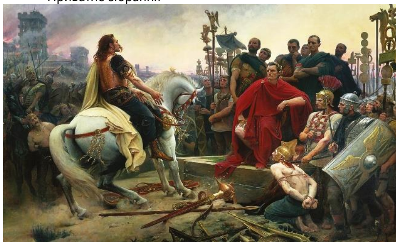
Рис. 5. Л. Ройєр. Верцингеторикс перед Цезарем. 1899. Музей Крозатьє, м. Ле-Пюї-ан-Веле, Франція

Битва завершилася поразкою галльських військ і взяттям фортеці військом Ю. Цезаря. Переможений військовий зображений у профіль, на коні, – чим художник звеличує шляхетність переможеного та жертвність галльського героя [17]. Переможець – на возведенні, в оточенні свити і охорони. Домінування головного персонажу картини підкреслено насиченим червоно-пурпурним кольором тоги та лавровим вінком.