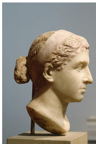
Рис. 1. Х. Луїс. Бюст Клеопатри. Altes Museum, м. Берлін, Німеччина