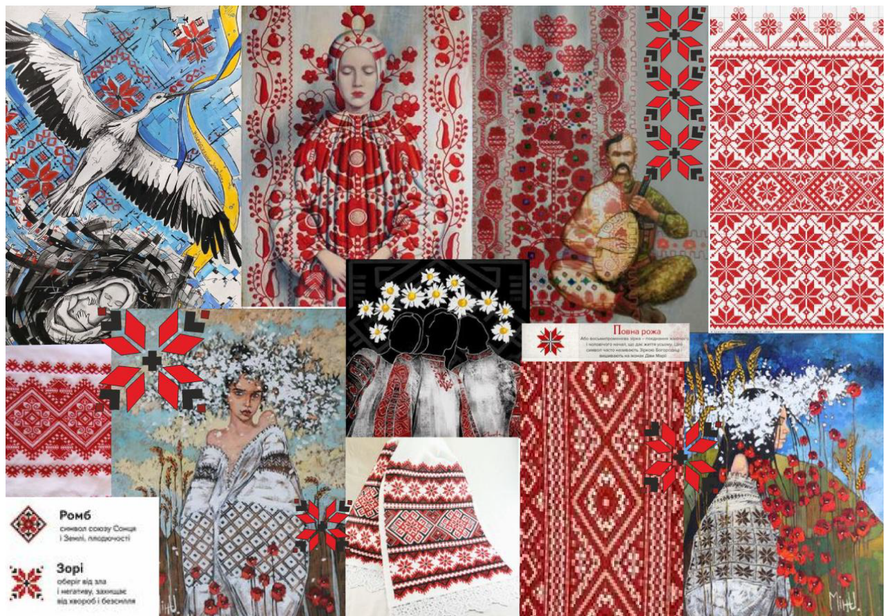
Рис. 2. MOOD BOARD «Український рушник»

Відомо, що творчий задум автора, на різних етапах, як проєктного так і виробничого процесу, найбільш доцільно представляють: пошуковий ескіз, фор-ескіз, творчий та технічний рисунок. Графічна манера та ступінь деталізації створюють особистий авторський стиль. На етапі ескізного проєктування відбувається остаточне наповнення форми, деталізація елементів та об'єднання окремих частин у цілісний структурний ансамбль одягу, взуття та аксесуарів.