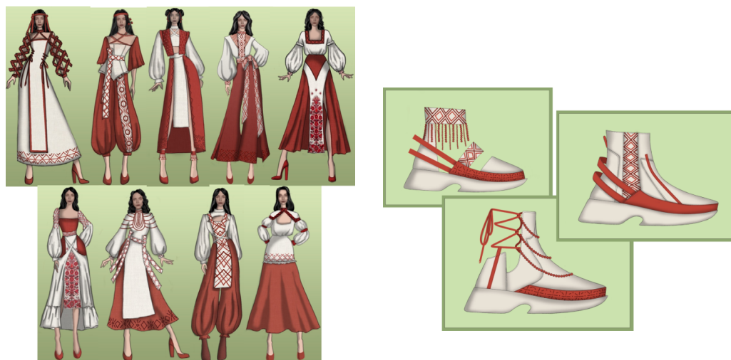
Рис. 4. Творча колекція «Український рушник»

трансформації орнаменту допомагають створити нові форми, текстури та образи. У цілому, використання національного орнаменту в дизайні творчої колекції жіночого одягу є дієвим засобом для створення