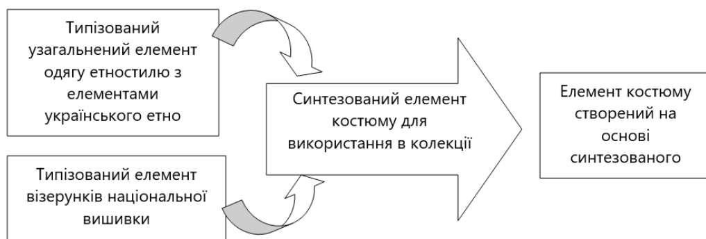
Рис. 4. Схематичне зображення творчого процесу отримання нових композиційних вирішень складових авторської колекції «Український рушник»

Творчий синтез нових дизайнерських рішень на основі типізованих елементів візерунків вишивки на українських рушниках Волинського регіону й типізованих рішень сучасного костюму дав змогу розробити ескізний ряд моделей одягу та взуття (рис. 4). Кожен образ колекції не лише відповідає творчому джерелу, а й тенденціям сучасної моди. Усі образи складається з прямокутних елементів, які відображають форми творчого джерела. А вишивка на рушнику – трансформується та прикрашає кожен образ. У всіх моделях є оздоблювальні елементи