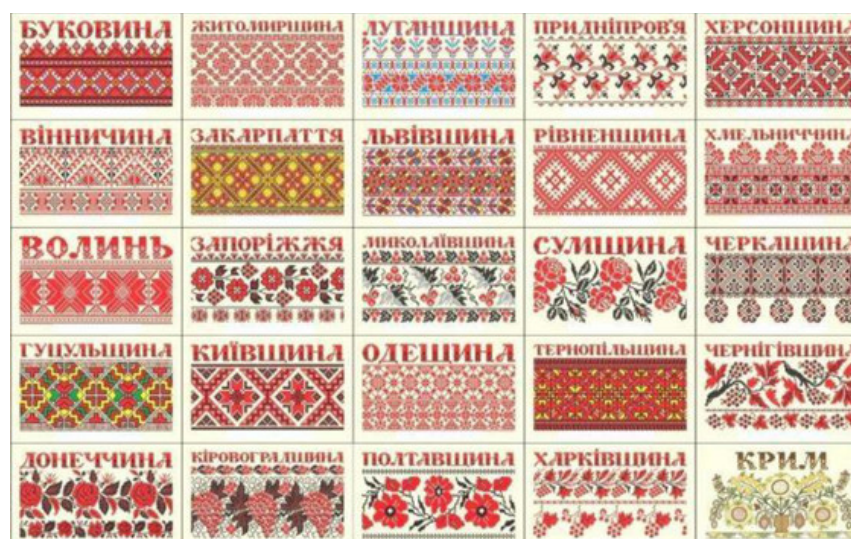
Рис. 1. Регіональна типізація крафтових національних візерунків [1]

української історії. У нашій країні вишитим рушникам завжди надавалося важливе образно-символічне значення. У візерунках відображаються культурна пам'ять народу, збережені давні магічні знаки, певний код та оберег (образ «Дерева Життя»), кольорова символіка. Кожен регіон України може пишатися своїми унікальними вишитими рушниками, які відрізняються комбінунням різних елементів, орнаментальних мотивів і візерунків, традиційних кольорів, технікою вишивання (рис. 1).