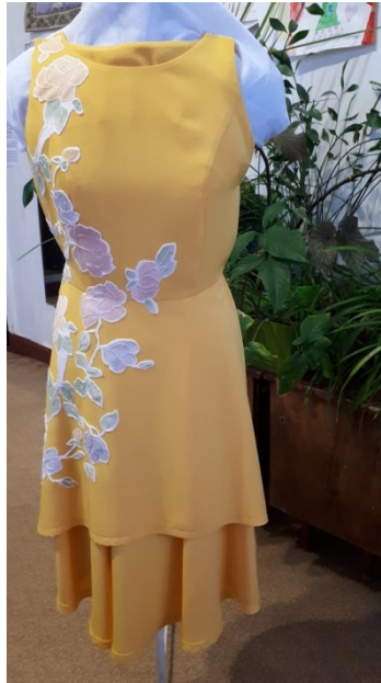
Рис. 4. Готовий виріб легкої сукні жіночого асортименту на фігуру А-типу (трикутник)