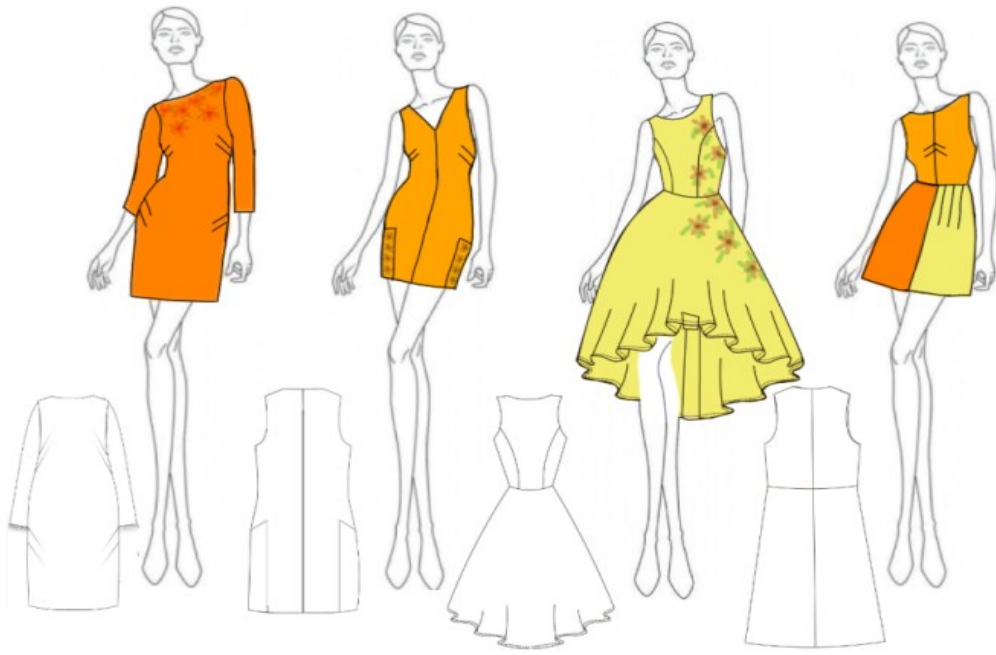
Рис. 2. Візуалізація ескізного проєкту дослідження