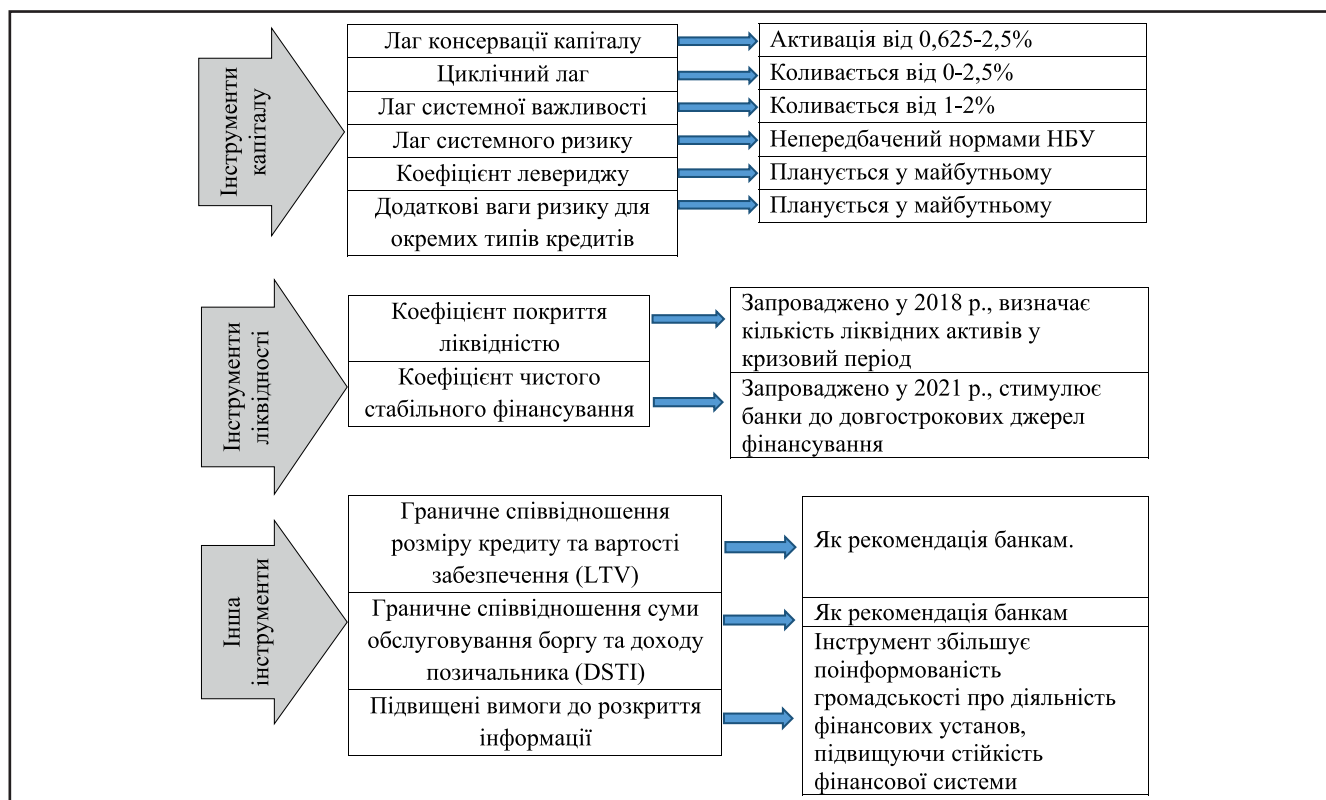
Рисунок 2. Основні макропруденційні інструменти в Україні

IV етап – макропруденційне реагування – на даному етапі відбувається втручання НБУ та