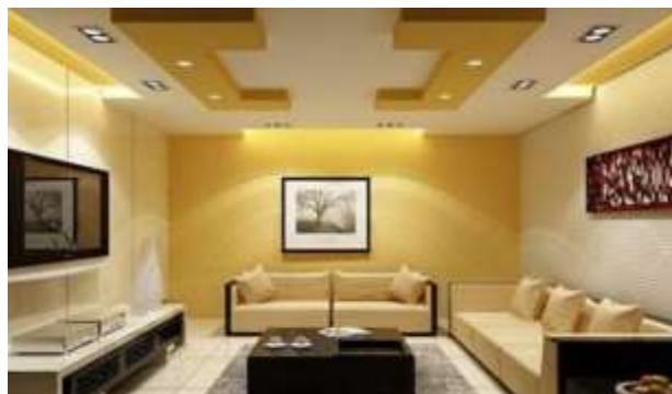
Рисунок 4 – Мінімалістичний інтер'єр номеру виконано за допомогою гіпсокартону Кнауф

Мінімалістичний сучасний інтер'єр. Використовуючи гладкий гіпсокартон та рівні плити, можна створити мінімалістичний сучасний інтер'єр. Білі стіни, стелі та підлога, вбудоване освітлення та мінімум декору дозволять зробити приміщення готелю візуально просторішим та світлішим. Яскравий приклад інтер'єру готелю в такому стилі наведено на рис. 4.