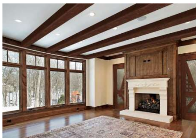
Рисунок 5 – Рустичний дизайн готельного номеру виконано за допомогою гіпсокартону Кнауф

Рустичний дизайн з дерев'яними елементами. Використовуючи гіпсокартон з імітацією дерев'яних балок та дошок, можна створити рустичний стиль. Такий дизайн ідеально підходить готелів та ресторанів, створюючи атмосферу затишку та тепла. Зразок готельного номеру у рустичному стилі наведено на рис. 5.