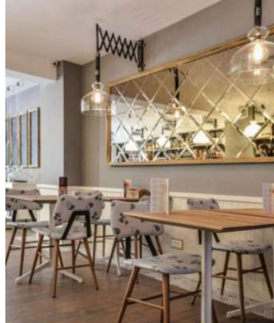
Рисунок 1 – Поділ простору на функціональні зони за допомогою гіпсокартону Кнауф

Зонування простору: Кнауф-дизайн дозволяє легко розділити простір на функціональні зони. Це особливо важливо для ресторанів і кафе, де можна створити різні атмосфери для обіду, вечері та відпочинку. Приклад такого інтер'єрного рішення наведено на рис. 1.