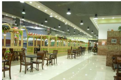
Рисунок 2 – Освітлювальні прилади вмонтовані в стелю кафе з гіпсокартону Кнауф

Ефективне освітлення: Правильне освітлення є важливою частиною дизайну закладів розміщення та харчування. Кнауф-дизайн може включати в себе світлодіодні рішення, що ефективно освітлюють простір та створюють атмосферу. Зразок використання такої технології наведено на рис. 2.