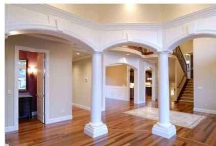
Рисунок 7 – Готельний лобі з деталями виконано за допомогою гіпсокартону Кнауф

Ці приклади демонструють, як різноманітні та креативні можуть бути інтер'єри, створені за допомогою проектної технології Кнауф-дизайну. Вона відкриває безмежні можливості для створення індивідуальних та вражаючих інтер'єрів у будь-якому стилі та для різних типів приміщень.