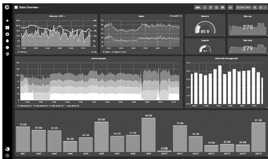
Рисунок 1 – Інтерфейс програмної системи візуальних даних Grafana

Для виконання поставленого завдання, передбачається створення окремого програмного засобу, який би виконував роль системи моніторингу. За приклад ми можемо взяти аналогічну програму Grafana, яка може вести зчитувати, аналізувати та порівнювати дані з опалювальних котлів [5]. Приклад інтерфейсу програмної системи Grafana наведено на рис. 1.