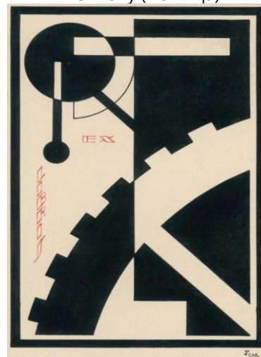
Рис. 4. Лев Гец. Екслібрис. 1930-ті рр.