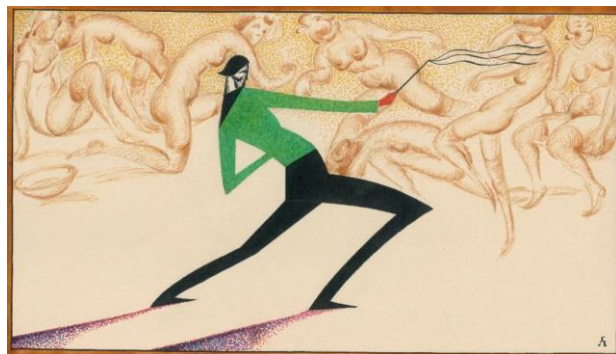
Рис. 6. Лев Гец. Екслібрис. 1930-ті рр. З архіву Історичного музею в Сяноку (Польща)