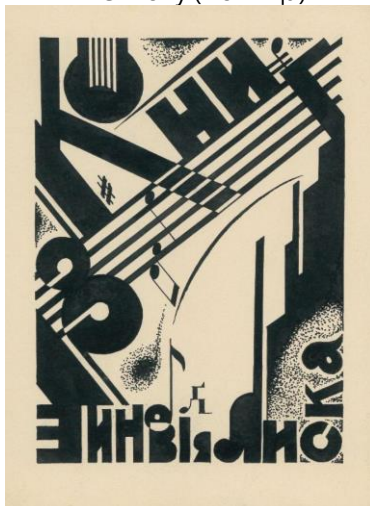
Рис. 3. Лев Гец. Екслібрис Зиновія Лиска. 1930-ті рр.