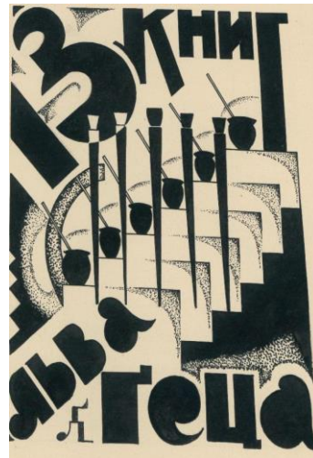
Рис. 2. Лев Гец. Екслібрис. 1930-ті рр.