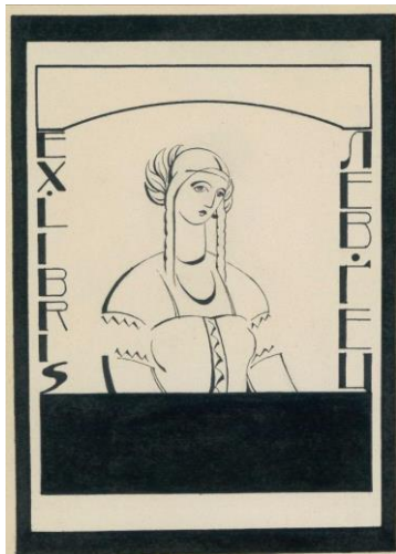
Рис. 1. Лев Гец. Екслібрис. 1930-ті рр. З архіву Історичного музею в Сяноку (Польща)