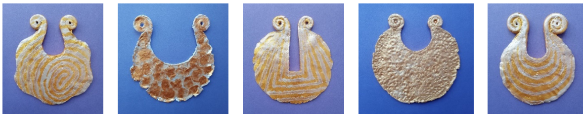
Рис. 4. Муляжні форми пекторалі. Автор Р. Сельський

В ході проєктних досліджень було прийнято рішення виконати в матеріалі гарнітур, до складу якого входять сережки та пектораль. Пектораль – це нагрудна прикраса, яка одягається поверх одягу, вона може бути такого ж самого стилю, що і сережки, представляючи єдиний комплект. Пектораль може бути як масивною за розміром, та і відносно невеликою. Матеріал для виготовлення – такий самий, що і для сережок, тобто це латунь, мідь, титан, срібло, золото, срібло з позолотою, емаль. Для кріплення пекторалі можливо використовувати як декоративний ланцюг різного дизайну, так і шкіряне кріплення, головне, щоб це все гармонійно поєднувалося спільним дизайном. На рис. 4 представлено муляжі різних форм пекторалі, виконані з акрилового пластиліну, який при висиханні стає твердим, легко піддається механічній обробці, а на його поверхні можливо виконати розпис різними видами фарб.