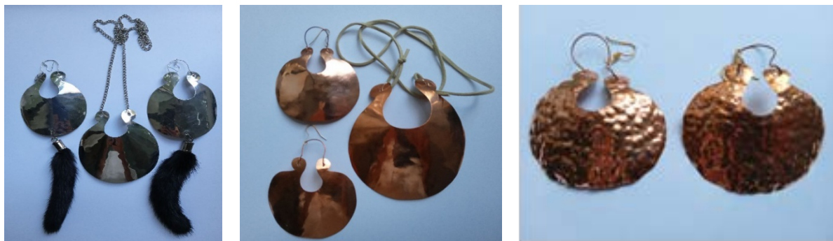
Рис. 5. Прототипи гарнітури, виконані з міді та латуні. Автор Р. Сельський

призначення виробу). Матеріал, з якого виготовлений прототип гарнітура, – це латунь, мідь, нержавіючий метал, або латунь із рельєфом протравленим в кислоті. Після протравлення можливе чорніння, в кінцевому варіанті виготовлення в металі можливо також застосування срібла, золота, срібла з позолотою (рис. 5).