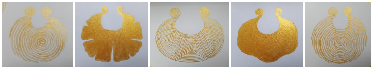
Рис. 2. Ескізи сережок (блок неформально-святкового призначення).

трипільських та давньоруських орнаментальних символів, а символи – це одна із форм спілкування, передачі інформації.