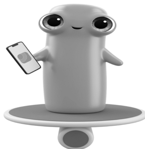
Рис. 2. Персонаж Котик в «Монобанк»