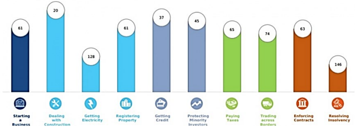
Fig. 1. Ukraine's place in the Doing Business rating for 2020

According to this indicator, Ukraine, unfortunately, only worsened its position over time (Fig. 1).