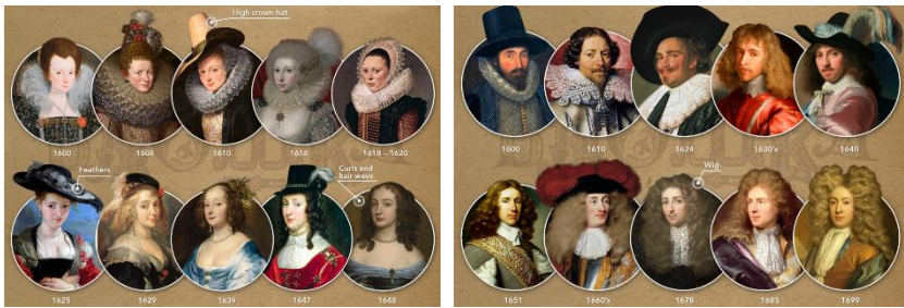
Рис. 1. Форма комірів між 1600 – 1699 роками [3]

7. Сучасна мода. Сьогодні мода пропонує широкий вибір комірів, від простих до екстравагантних, залежно від особистих уподобань і стилю одягу. Коміри можуть бути зйомними та додаватися, щоб персоналізувати одяг, або вони можуть бути невід'ємною частиною дизайну вбрання.