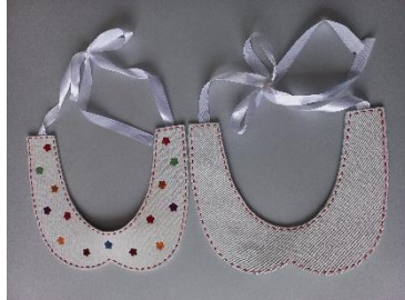
Рис. 4. Схема коміра (спереду та ззаду)

Деякі коміри колекції мають дві грані (рис. 4). Тому один і той же виріб можна носити по-різному, один раз з орнаментом, інший раз без орнаменту.