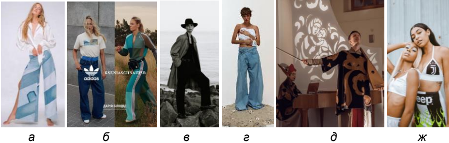
Рис. 1. Моделі одягу, створені на основі апсайклінгу вживаних речей: а – Ksenia Schnaider; б – Ksenia Schnaider та Adidas Originals 2023; в – Oversized Studio; г – Bettter; д – ReSew (для театрального перформансу); ж - Frankie Collective